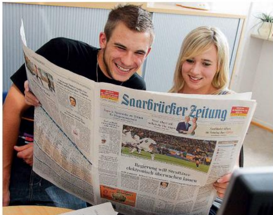
In dem Forschungsprojekt können Unternehmen ihre Azubis anmelden. Die Universität Koblenz-Landau testet das Wissen der Teilnehmer vor und nach dem Projekt.

Die Universität Koblenz-Landau hat zu Beginn der Aktion das Allgemeinwissen der Teilnehmer getestet. Alle vierzehn Tage stellen sich die jungen Menschen seit Herbst letzten Jahres einem Wissensquiz zu aktuellen Themen. Am Pro-