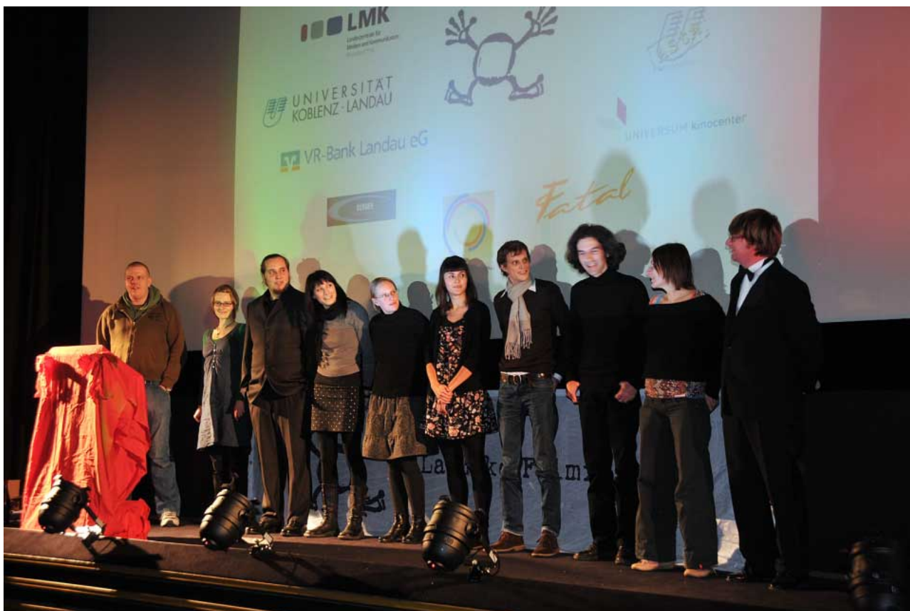
Sorgen jährlich für cineastische Kurzweil: Die Macher des Landauer Kurzfilmfestivals La.Meko.