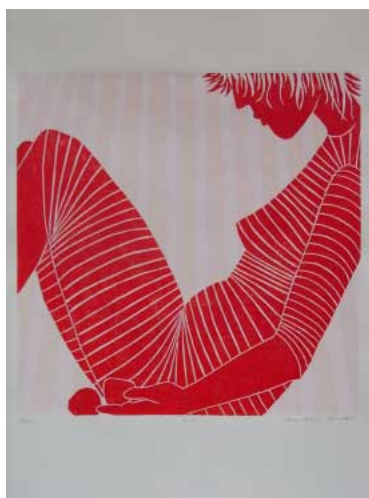
Ann-Katrin Schmitt - Erdbeerfeld -, 2009/2010 Holzschnitt über Siebdruck