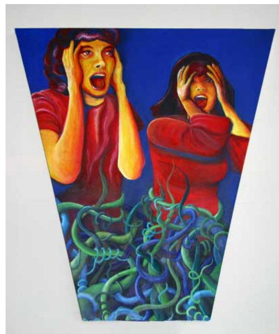
Andrea Schröer - Help -, 2009/2010 Acryl auf Leinwand

Begleitend zur Ausstellung wartet ein kurzweiliges Kulturprogramm auf Landau und Region: