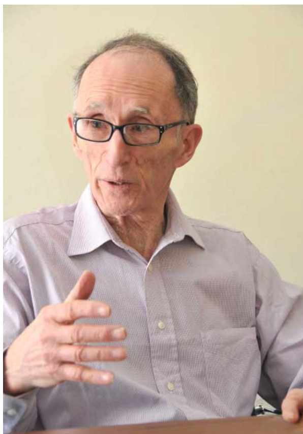
Hat aufsehenerregende Untersuchungen zum Afro-Amerikanischen Englisch durchgeführt: William Labov.

William Labov ist Begründer der amerikanischen Soziolinguistik. Aufsehen erregte er mit seinen Untersuchungen zum „Afro-Amerikanischen Englisch“, der Sprache der schwarzen Bevölkerung der Vereinigten Staaten. Seiner Auffassung nach ist das „Black English“ kein defizitärer Dialekt, sondern eine Sprachform mit gleichen Rechten und Gesetzen wie die Standardsprache des Amerikanischen Englisch. Labov empfahl daher den amerikanischen Schulbehörden, Schulbücher in „Black English“ einzuführen und in diesem Zusammenhang wurde er auch zu Anhörungen als linguistischer Experte ins Weiße Haus geladen. Neben Untersuchungen zu ethnischen Dialekten forschte William Labov zu regionalen und sozialen Dialekten, indem er Sprachwandel und -variation von Ober-, Mittel- und Unterschichten betrachtete. Seine Publikationen umfassen unter anderem das monumentale Werk „Atlas des Nord-amerikanischen