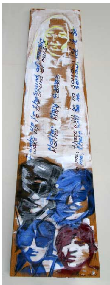
Nicole Braun - Sound of Musik -, 2009/2010 Acryl auf Leinwand