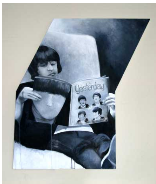
Miriam Schall - Yesterday -, 2009/2010 Acryl auf Leinwand