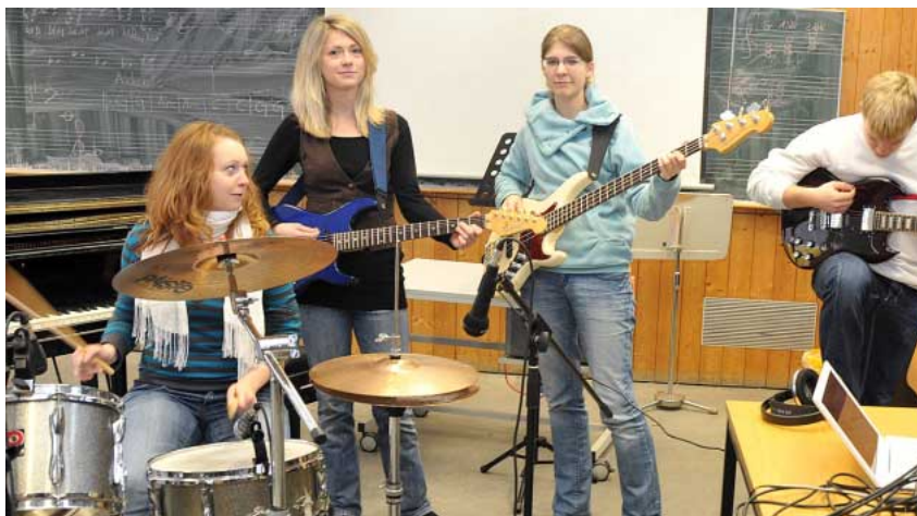
Frauenpower: Gekonnt spielen die Studentinnen die einzelnen Tonspuren für die Klangcollagen ein.

ten Song, sondern auch jede Tonspur anhören kann.