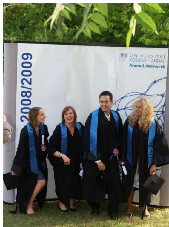
Gebührend den Uni-Abschluss gefeiert – das haben 205 Absolventinnen und Absolventen am Campus Landau.

deskreises der Universität an die sieben Mentorinnen des Mentoring-Programms für junge Absolventinnen. Ziel dieses Projektes, das 2007/2008 zum ersten Mal mit Mitteln des Ministeriums für Arbeit, Soziales, Gesundheit, Familie und Frauen durchgeführt wurde, ist es, jungen Frauen nach dem Abschluss ihres Studiums durch eine Partnerschaft mit einer beruflich bereits erfolgreichen, älteren Absolventin den Einstieg in die Arbeitswelt zu erleichtern. Die Geehrten stifteten das Preisgeld in Höhe von 1000 Euro gleich für