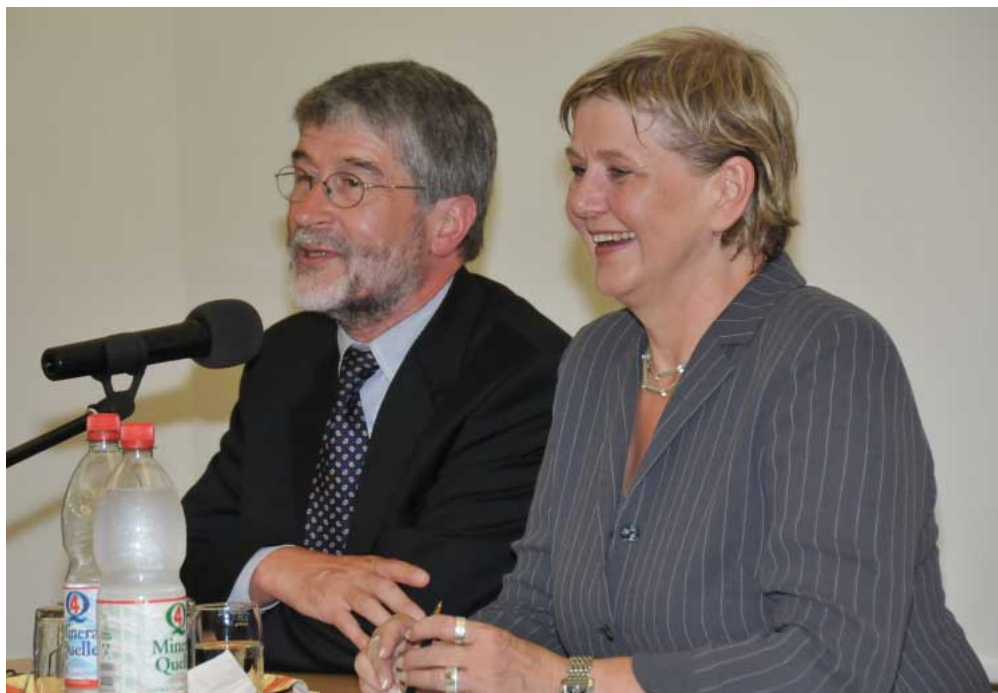
Ein spannender Abend zu einem aktuellen Thema: Marianne Birtler, Bundesbeauftragte für Stasi-Unterlagen (hier im Bild mit Uni-Vizepräsident Ulrich Sarcinelli), war Gast beim Semesterpolitikum.

Insgesamt über hundert Kilometer Staatssicherheitsakten seien archiviert worden. 16.000 Säcke mit zerrissenen Unterlagen gäbe es insgesamt, von denen bisher die Akten aus 400 Säcken rekonstruiert werden konnten. „Diese Unterlagen sind eine unentbehrliche zeithistorische Quelle“, sagte Birthler.