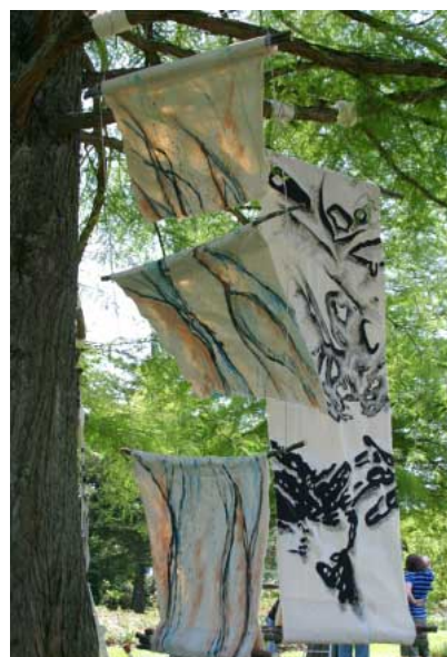
Landart-Projekt aus dem Sommer 2008 im Zweibrücker Rosengarten.

dem Programm: Der Raum im Bild: Didaktik der dritten Dimension (Diethard Herles), Fauna und Bild: Der Tierpark als pädagogisches Bezugsfeld bildnerischen Handelns (Gudrun Hollstein und Susanne Grittmann), Kunst in der Natur – Kunst aus Natur: Künstlerische Projekte der Begegnung und Auseinandersetzung mit Natur (Günther Berlejung und Rainer Kaufmann), Bild und Arbeitsraum: Der Einfluss der Umgebung auf die künstlerische Arbeit (Tina Stolt), Bilder aus Stein und Metall: Besuch im Bildhaueratelier (Volker Krebs) und Digitale Bildbearbeitung: Banale Beliebtheit oder gestalterische Chance (Michael Schacht).