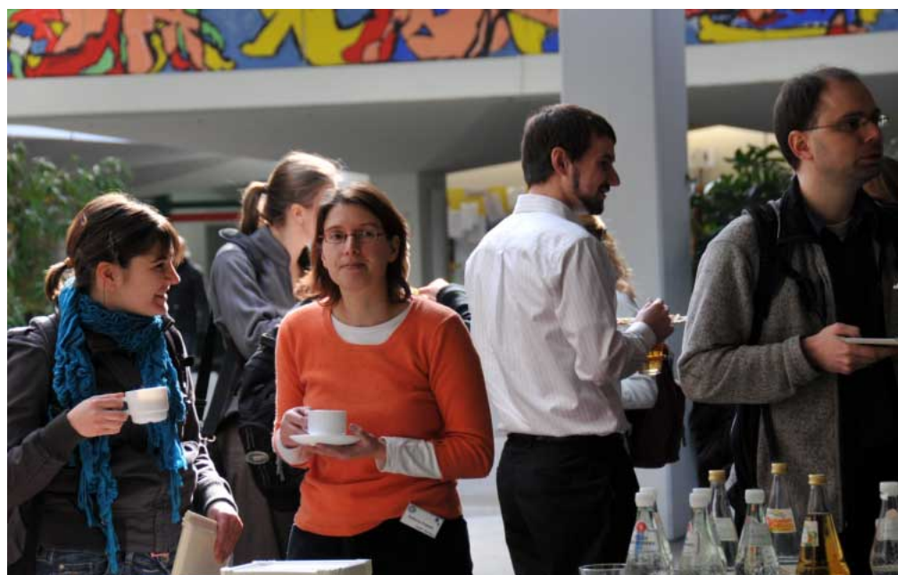
Unter sich: Auf dem ersten YES-Meeting tauschten Studierende der Umweltwissenschaften aus aller Welt unverbrauchte Ideen aus und knüpften Netzwerke.